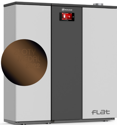
FLAT 11 kW